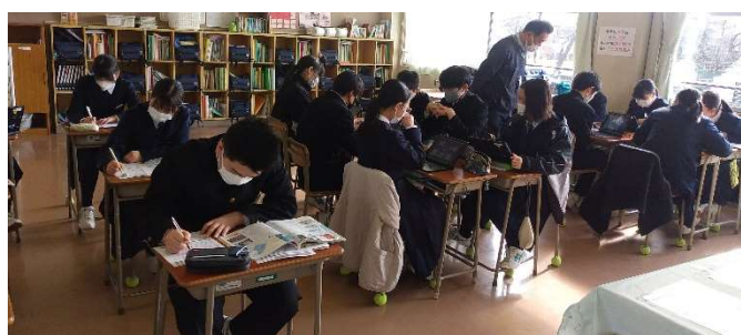
3A 社会科(公民的分野)の授業

紫波三中の3年生は、今、まさにこのような状況です。明日から3月。いよいよラストスパートです。健康に留意し、感動のフィナーレを皆で迎えられるよう、皆が1分1秒を大切に過ごしてほしいと強く願います。 応援しています！