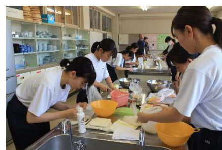
調理室で下ごしらえ