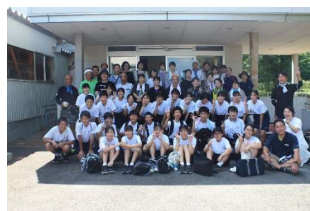
みんなでパシャリ！