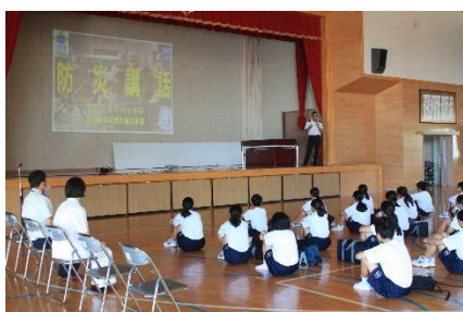
自衛隊員による防災講話

夏休みに入って間もなくのこと。PTA 親子レクとして、7月29日（土）は2年生、30日（日）は1年生の防災キャンプが行われました。両日とも、自衛隊の方々による防災講話、災害時に使える新聞紙を使ったスリッパづくり、そして、火おこしと避難時の炊事体験をしました。暑い中でしたが、参加された生徒たちはもちろん、お家の方々も真剣に、そして楽しく活動しており、たくさんのお話を学ぶことができたようです。ご協力していただいたお家の方々には感謝申し上げます。誠にありがとうございました。（写真は2年生の様子）