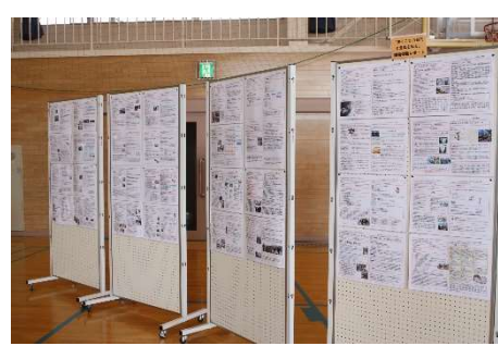
一人ひとりまとめました(2年生)