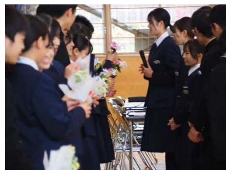
新旧執行部の引継ぎ