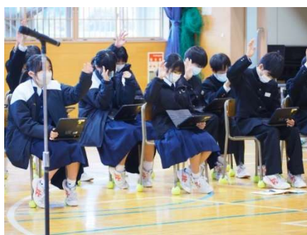
挙手をして意見を述べます