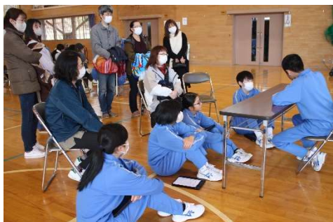
学習してきたことを発表する様子

後に行われた高校入試説明会では、卒業後の進路に関わる大事な説明や質疑が行われました。3年生はこれから特に大事な時期を迎えます。他人ではない、自分のことです。強い意志をもって、目標を達成できるように、努力を積み重ねてください。学校も、保護者も、地域もみんなのことを応援しています。